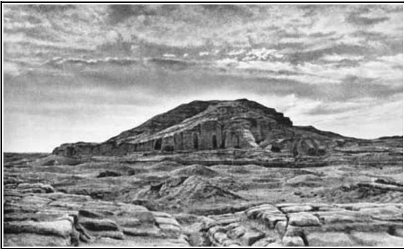
Ziggurat nel Settore Eanna a Uruk (Andre Parrot, Sumer )

Un altro giorno di viaggio e arrivarono a Uruk, dopo di che Gilgamesh raccolse il filo del suo passato. "Sali, Urshanabi, sul muro di Uruk. Ispeziona la base; guarda la muratura. Non è il suo nucleo fatto dai mattoni cotti al forno? Non furono i sette saggi a progettare il piano delle sue fondamenta? A Uruk, la dimora di Ishtar, una parte è città, una parte frutteti, e una parte cave di argilla. Tre parti, e il tempio di Ishtar [Eanna] chiude il muro di Uruk." E spirito, anima, e corpo costituiscono ancora Gilgamesh che, castigato ma più saggio dalla sua esperienza, ora riprende il lavoro della sua vita, simbolizzato dal muro guardiano di Uruk che sempre protegge la nostra umanità.