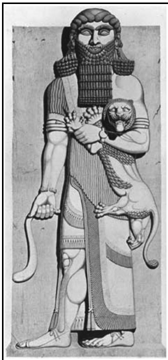
Gilgamesh, VIII Secolo a. C. Palazzo di Sargon II, Khorsabad

agli animali. Questo era l'uomo primordiale — "l'uomo com'era in principio"— rappresentante delle prime razze prima che la mente e la semi-coscienza fossero risvegliate.