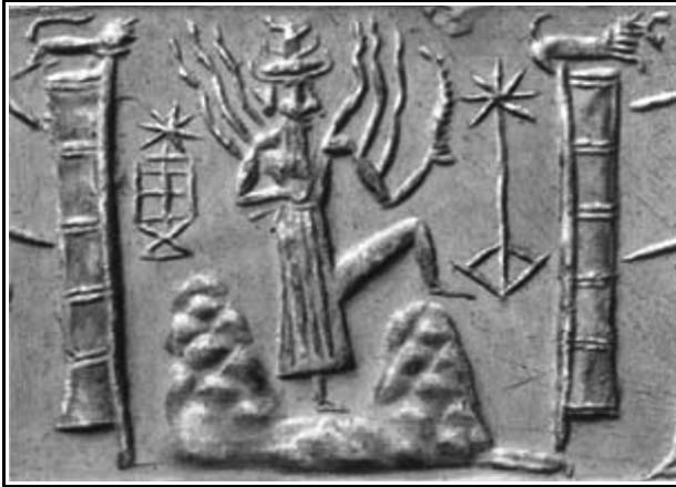
Shamash (il Sole) tra le Cime Gemelle del Mashu, Accadico, 3° millennio a. C. (British Museum).

"Nessun mortale l'ha mai fatto," disse l'uomo-Scorpione.