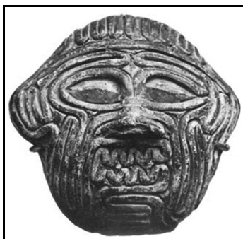
Humbaba, VII secolo a. C. (British Museum)

Dopo aver ricevuto il loro consiglio e le loro preghiere, Gilgamesh ed Enkidu partirono (nella versione sumera: con sette guerrieri e cinquanta uomini celibi) per un arduo viaggio verso la foresta di Enlil dove cercarono di annientare il custode e di abbattere il Grande Cedro. Enkidu conduce il percorso, perché conosce la "strada più sicura" per la foresta, conosce i trucchi di Humbaba, ed è esperto di battaglie. Deve proteggere Gilgamesh e aiutarlo a portarlo in salvo.