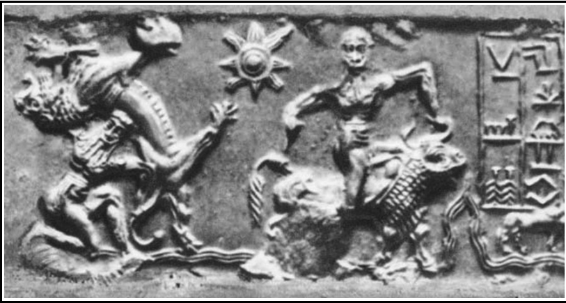
Gilgamesh e Enkidu. Sigillo cilindrico proveniente da Ur, 3° millennio a. C., altezza 1-1/ pollici.

Ishtar maledisse Gilgamesh; l'aveva diffamata e conquistato il Toro del Cielo. Quando Enkidu udì le sue maledizioni, strappò la coscia del toro e gliela gettò in faccia. Ishtar appoggiò la coscia e, insieme alle sue cortigiane del tempio, proruppe in un grande lamento. Nel frattempo Gilgamesh rivendicò le corna, simbolo di maestria e saggezza, e le sospese nella camera da letto del suo dominio. Gilgamesh e Enkidu si lavarono le mani nell'Eufrate; si abbracciarono e cavalcarono per le strade di Uruk. Gilgamesh, il migliore degli uomini; [Enkidu?], il più audace tra i compagni.